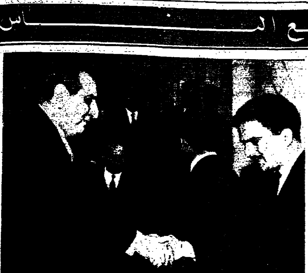
الرئيس اللبناني الصفي بصادق - ج.ح.ج. ولي العهد المعظم ولي الصورة السيد بهجت التلهوني رئيس الوزراء

لندن - رويتر - قبضت فنانان ترتديان ثوبين قصيرين وامرأة متقدمة في السن على لص فسار فيما كن ينتظرن سيارة ركاب . وقد ركن السيارة واخترقن قبل ان تتاح للبوليس قرصة لشكرهن . ووقع الحادث عندما ارغم ثلاثة لمسوس تسلموا بيناقت سيد نشرت انابيلها سيارتها قبل مرتبات على الارتطام بحائط وسرعوا صندوقا يحتوي على ستة آلاف جنيه استرليني . ولكن سيارة دورية وصلت بسرعة ففر لصان بعد التواء الضميمة ايا اللص الثالث فقد قذفته غداة بحقيبة فسقط على الارض وجلست النساء الثلاث عليه حتى وصل البوليس !